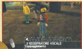
REGISTRATORE VOCALE Equipaggiamento

- OGGETTI : l'oggetto che avrete fin dall'inizio e che si rivelerà il più importante, è il registratore vocale . Codesto apparecchio non serve, come forse avevate pensato, a fare delle interviste ai personaggi del gioco, bensì a salvare i vostri progressi. Con la semplice selezione del menu e la pressione del tasto X avrete accesso alla memory card. Non c'è limite al numero dei salvataggi dato che si possono sovrascrivere. Un'altra funzione di questo sottomenu è la possibilità di usare gli oggetti trovati o comprati, come per esempio la fune uncinata et similia. È possibile richiamare in qualsiasi momento un oggetto di questo inventario ma, naturalmente, esso avrà la sua efficacia solo se utilizzato nel luogo e al momento giusto.