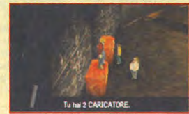
Tu hai 2 CARICATORE.

- CARICATORI : una delle cose che più mi ha divertito del gioco è sicuramente quando ho trovato i primi caricatori. È comparsa una scritta che diceva "tu hai 5 CARICATORE". A ogni modo, strafalcioni a parte, potrete trovare dei colpi supplementari per la vostra pistola sia nelle varie locazioni, sia nei negozietti sparsi per la città. Fatene buon uso poiché in giro non ce ne sono