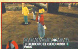
GILBOTTINO DI CUIO ROSSO Vestiti

- ABBIGLIAMENTO : a disposizione del giocatore, avremo anche una vasta gamma di vestiti da poter scegliere. Ognuno offrirà una resistenza più meno spiccata ai colpi nemici. Di default avrete l'orribile giubbotto variopinto di Acarno che resisterà ai proiettili come il burro contro una lama riscaldata.