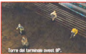
Torre del terminale ovest 8P.

l'uso appropriato degli oggetti trovati. Sarà possibile, inoltre, comprare e vendere oggetti, dal momento che vi verrà dato un piccolo budget da poter spendere subito in